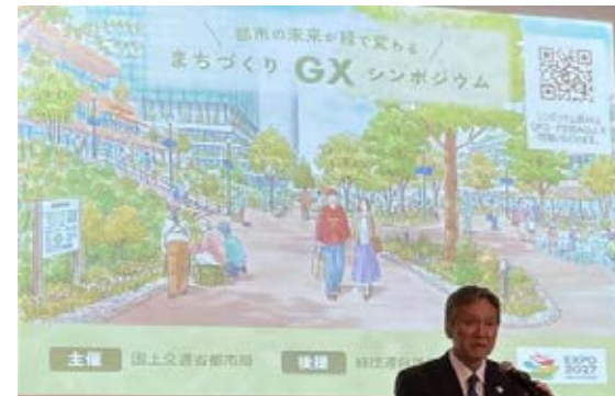
(国土交通省) まちづくりGXシンポジウム挨拶