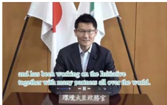
(環境省) HLPFサイトイベント挨拶