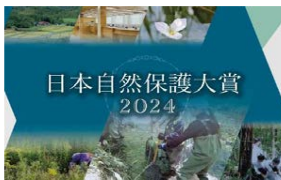
(日本自然保護協会) 日本自然保護大賞への協賛