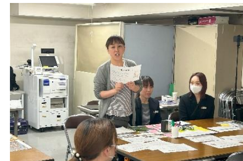
小売店従業員を対象にしたワークショップの様子