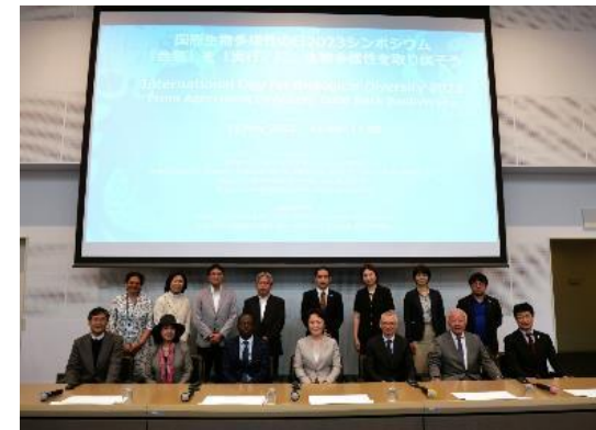
国際生物多様性の日 2023 シンポジウム（前列中央は山田環境副大臣）