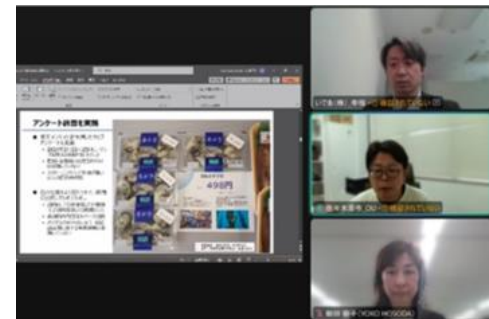
因果分析を用いた行動変容手法の分析発表の様子

Behavior Change For Natureを中心に、行動変容に関する研究・実践事例を整理。他