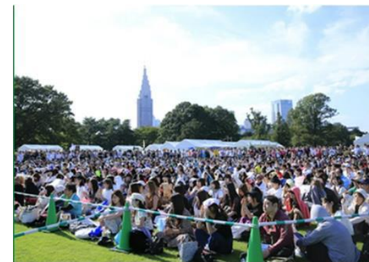
GTFグリーンチャレンジデーのステージ前の様子